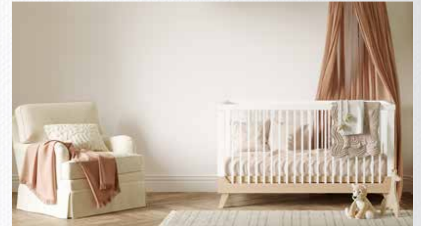
Wohn- und Schlafräume