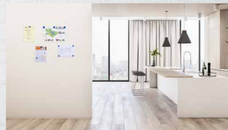
Infoflächen in Küche oder Flur

Weitere Infos zu SYSTEXX Active Magnetic und Magnetic Whiteboard