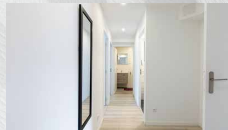
Flure und Treppenhäuser

Alle SYSTEXX Pure Designs online ansehen