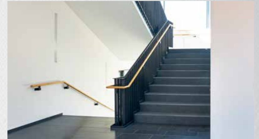
Flure und Treppenhäuser