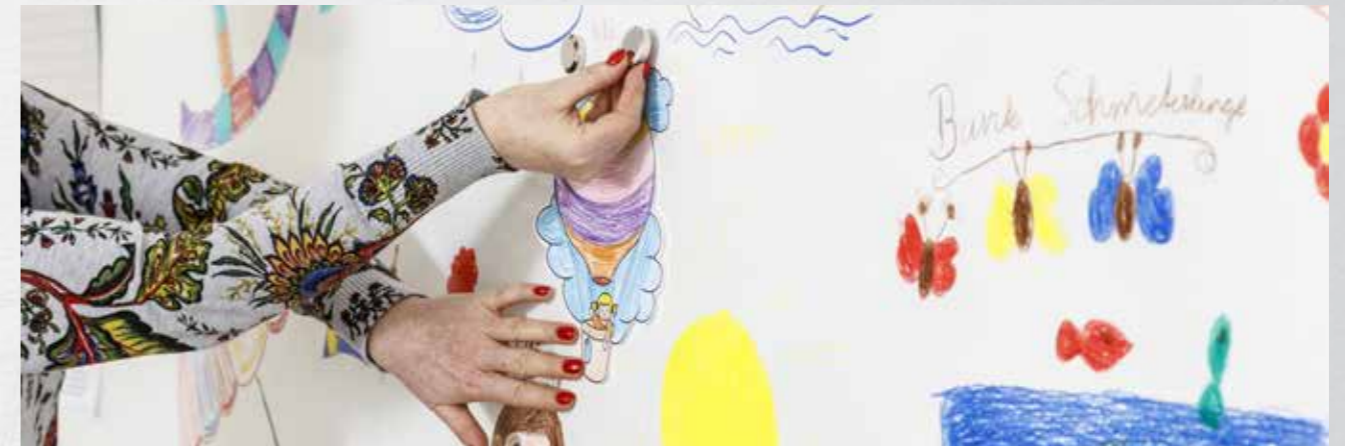
Kindergärten und -tagesstätten