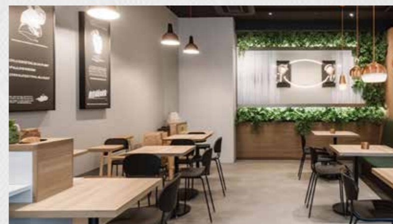
Mensen und Kantinen

Alle Designs von SYSTEXX Phantasy und Pure