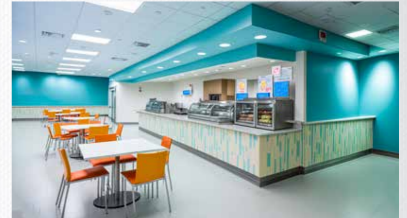
Cafeterien und Aufenthaltsräume