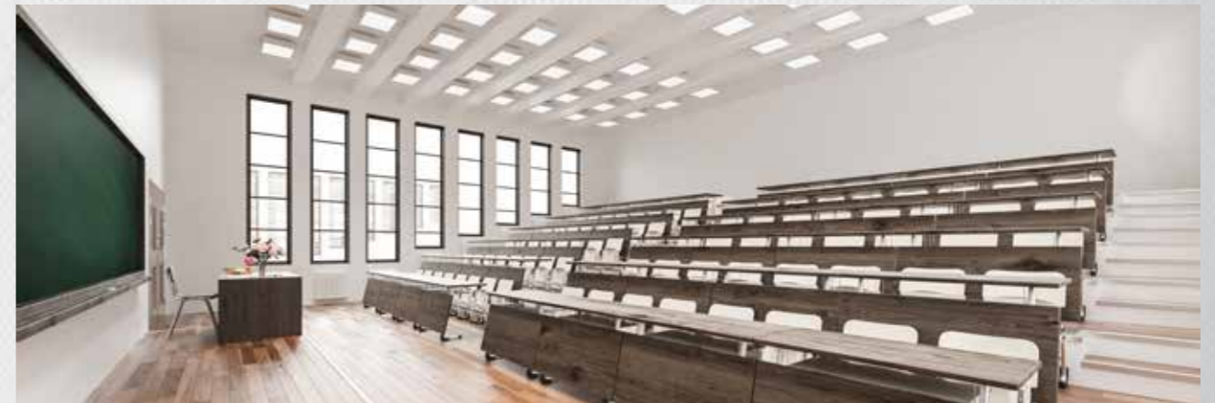
Klassenzimmer und Hörsäle