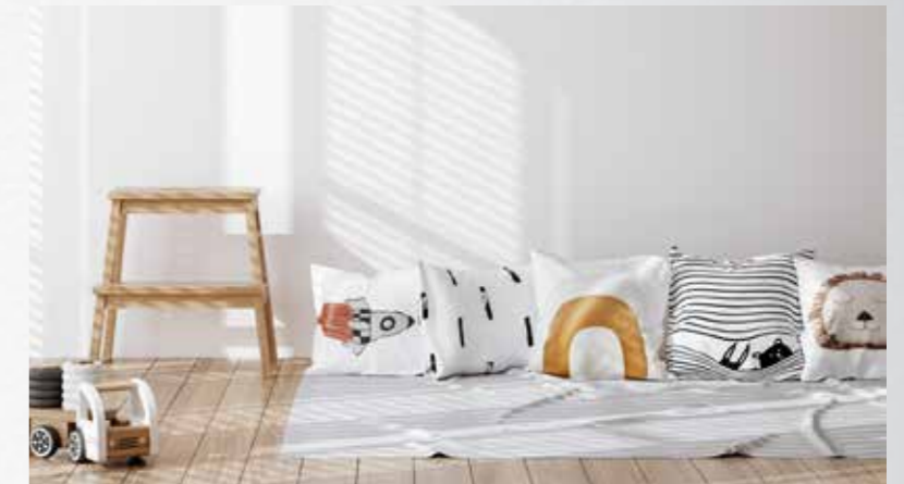
Ruhe- und Schlafbereiche