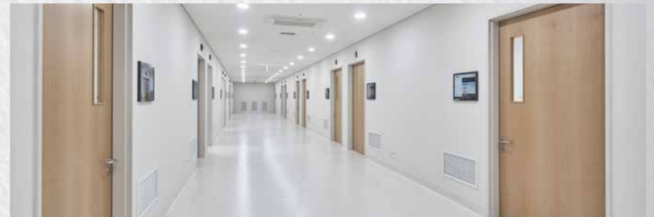
Flure und Verkehrswege