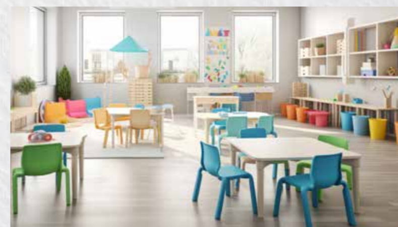
Spielzimmer und Aufenthaltsbereiche

Detailinformationen zu SYSTEXX Active Reno online: