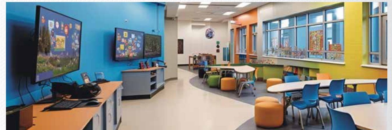
Hörsäle und Klassenräume